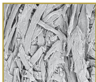
Paberteip 250x suurendus